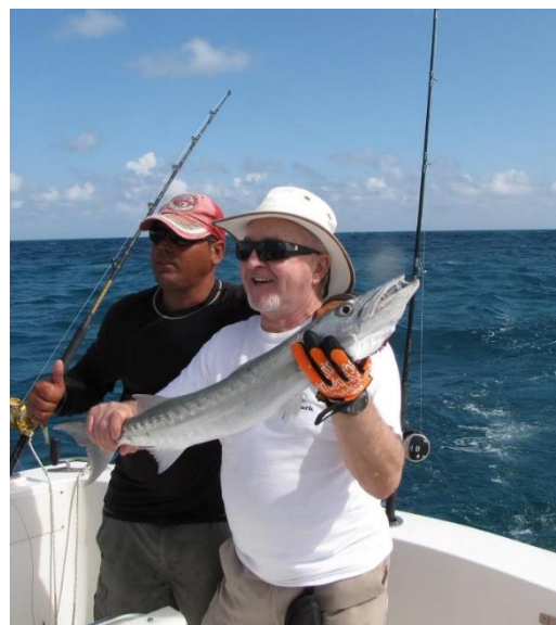
Pêche en mer profonde à Cuba.

Au fil des années, il fut transféré souvent dans des villes telles que Calgary (deux fois), Winnipeg (deux fois), Prince Albert, Grande Prairie et Saskatoon. Il se trouve chanceux d'avoir aussi passé deux ans au Siège Social à Montréal.