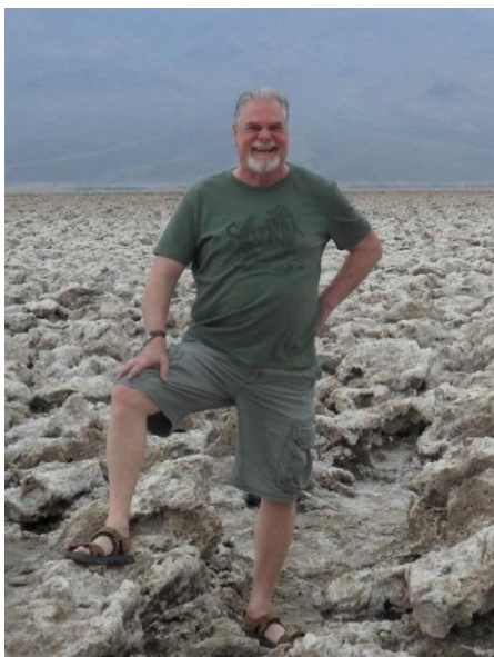
Terrain de golf : 'Devil's Golf Course' – Parc national de la Vallée de la mort